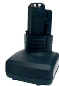
Pacco batteria (2 inclusi) 5800mAh